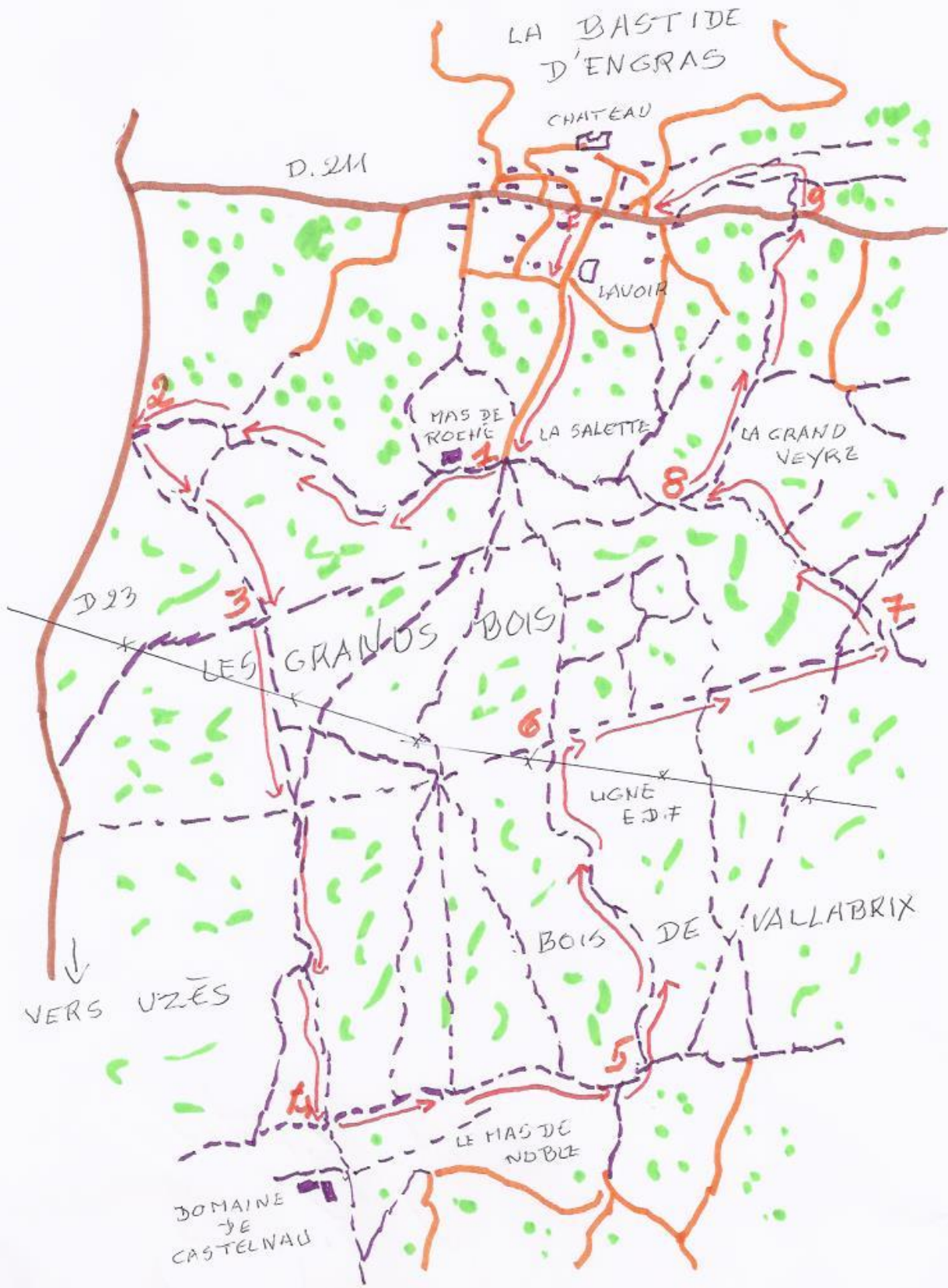
À reporter sur la carte IGN 2941 O - Uzès